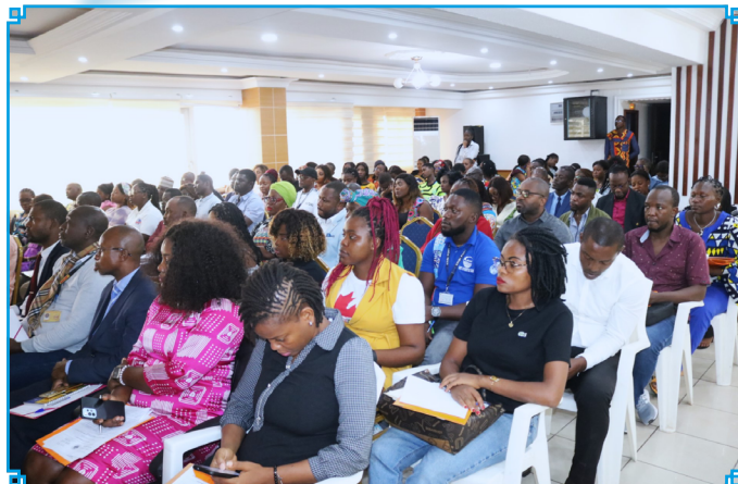
Participants at the training