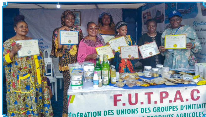
Winners brandish their recognition awards