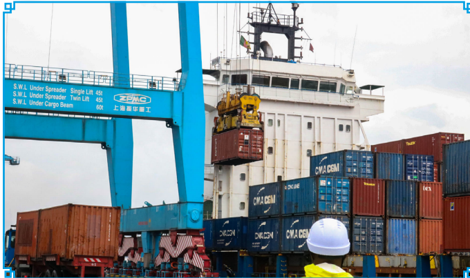
Loading of aluminium ingots