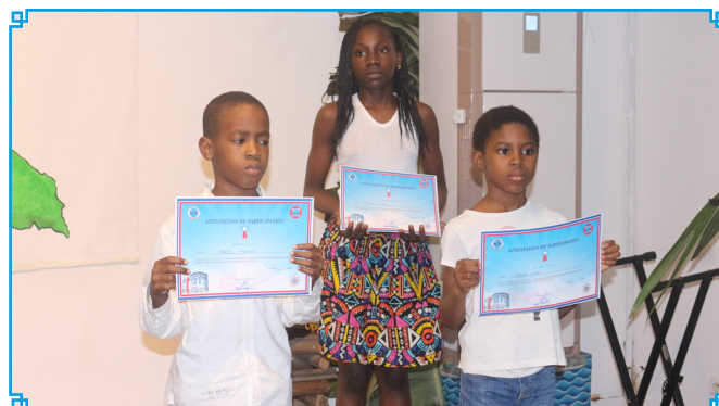
Des enfants présentant leurs attestations