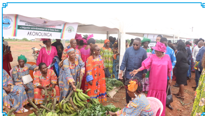
Achats et ventes effectifs