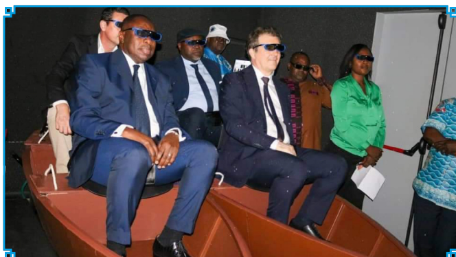
Storm Room experience