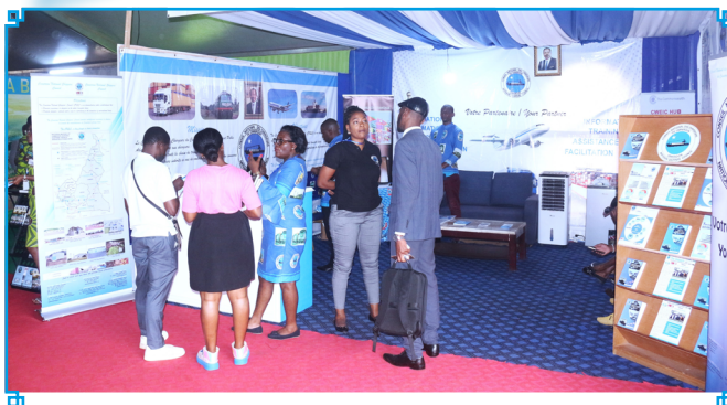
Des visiteurs sensibilisés au stand du CNCC