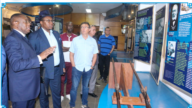
Brazilian sailors visit the museum