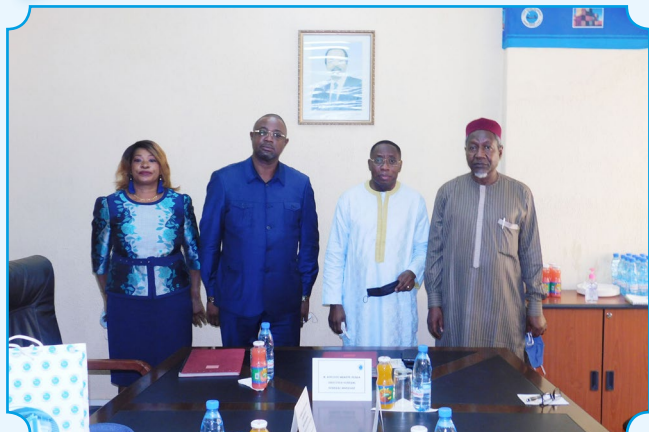
General Managers of both Councils

Apart from working to strengthen shippers assistance mechanisms, the Union of African Shippers' Councils (UCCA) of which the Congolese Shippers' Council (CCC) and the Cameroon National Shippers' Council (CNSC) are members, also encourages cooperation between its members. It is in line with this that the CNSC houses the CCC field office in Douala.