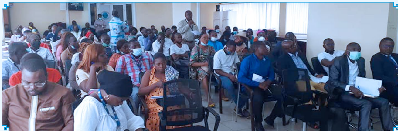
Participants at the training seminar

On 4 November 2021, the Cameroon National Shippers' Council (CNSC) organised and hosted a practical training seminar on the electronic procedure for obtaining the phytosanitary certificate. The interactive seminar featured practical cases on the e-GUCE ( Single Window ) and SIAT (MINADER technical control) platforms. In order to ensure the mastery of import / export operations and in line with its supervisory role, the CNSC is resolutely committed to ensuring the practical training of shippers on various import and export-related procedures.