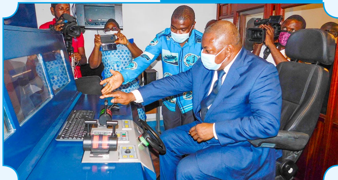
Visite au Musée Maritime de Douala