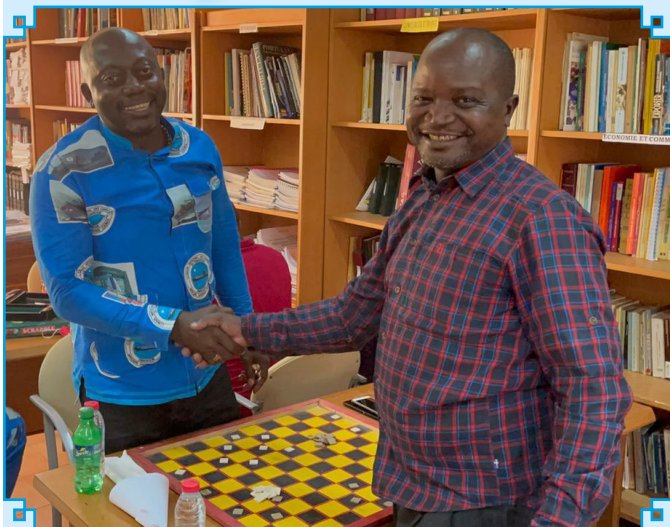
Fair play prevailed