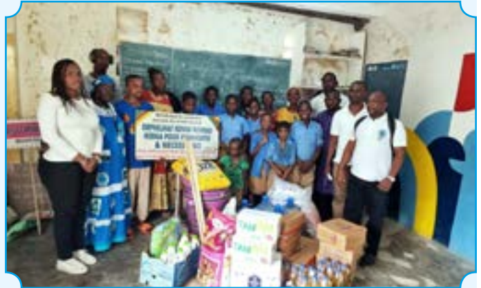
Des orphelins posent avec leurs cadeaux

Cameroon, headquarters of the Union of African Shippers' Councils (UASC), hosted the ordinary session of UASC's Steering Committee on 6 and 7 December 2023 in Douala, at the premises of the Cameroon National Shippers' Council (CNSC). The session was chaired by Mr. Abdoulaye Diop, UASC's newly elected Chairman, who doubles as General Manager of the Senegalese Shippers' Council (COSEC). Over the two days of the session, delegates from the Union's member countries examined the activities carried out in 2023 and outlined an action plan for 2024. The session was attended by Shippers' Councils from Burkina Faso, Congo, Chad, Mali, Guinea Conakry, Togo, Gabon, Senegal, Nigeria, Angola, Ghana, Côte d'Ivoire and Cameroon, the host country.