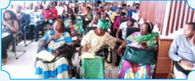
Cross-section of participants at the seminar