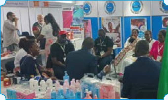
Séance de travail avec AFREXIMBANK