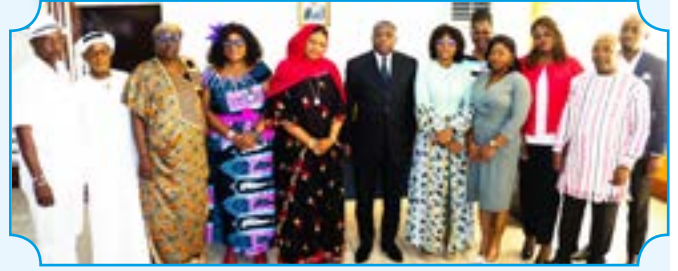
Les nouveaux Délégués du personnel