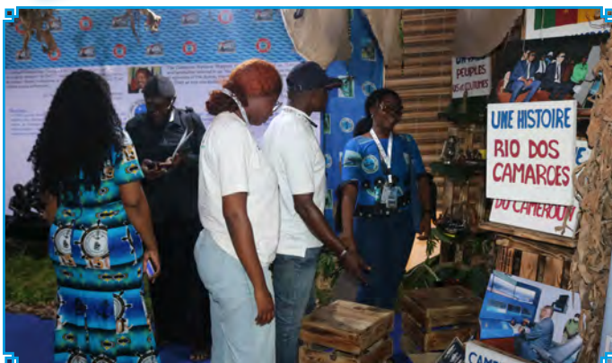
Le stand envahi par les visiteurs