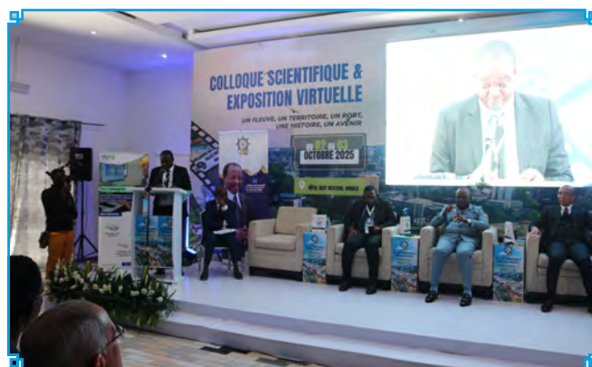
CNSC's representative at the conference

C'est avec beaucoup de nostalgie que les visiteurs parcouraient les photos renvoyant aux étapes ayant marqué le développement du Port de Douala-Bonabéri, ses premières activités, l'arrivée des premiers navires et l'ouverture des maisons de commerce. Quelques rares clichés de la ville de Douala avant les indépendances aux cotés des plus récents faisaient la fierté. Les visiteurs pouvaient reconnaître l'hôtel Akwa Palace, la cathédrale Saint Pierre et Paul dans toutes leurs transformations.