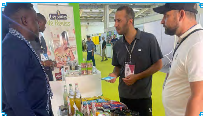
Visit to Cameroon's Stand