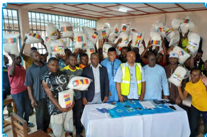
Les heureux bénéficiaires