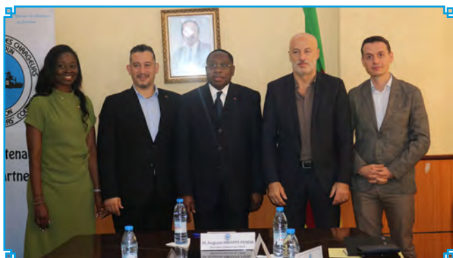
Les visiteurs et leur hôte