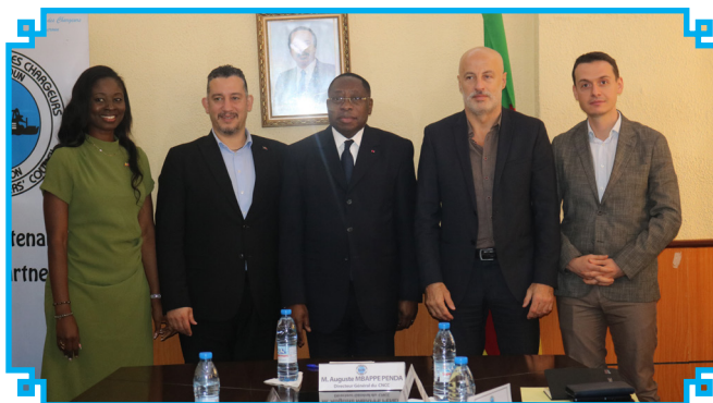
Le Directeur Général du CNCC et la délégation turque

La délégation des exportateurs turques sollicite le CNCC pour l'organisation de sa mission économique.