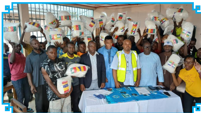
Les récipiendaires des moustiquaires

Les transporteurs du Centre de Vie CNCC de la Dibamba reçoivent les moustiquaires.