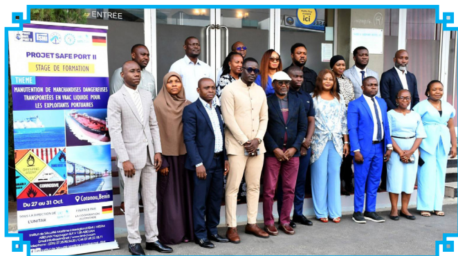
Les participants aux travaux

Le CNCC prend part aux travaux à Cotonou.