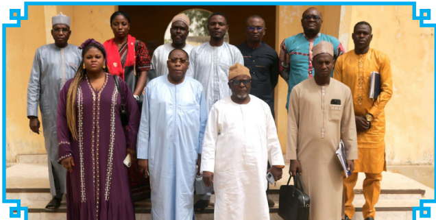
Photo de groupe

Le Directeur Général du CNCC sur le terrain à l'Extrême-Nord.