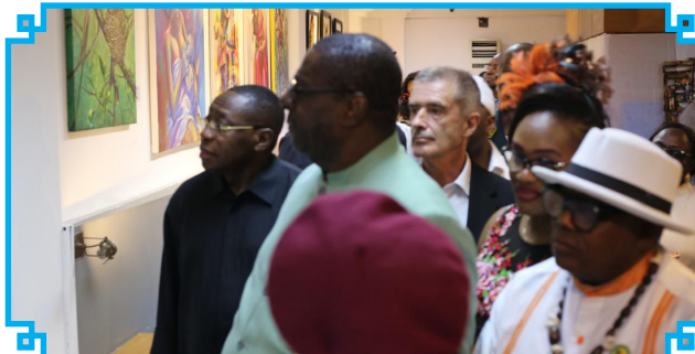
La découverte des œuvres d'art

Des artistes plasticiennes exposent leurs œuvres d'art.