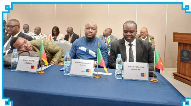
Le représentant du CNCC

L e 08 décembre 2025, le Conseil National des Chargeurs du Cameroun ( CNCC ) a pris part à l'atelier sous-régional sur la mise en œuvre du Guichet Unique Maritime, organisé à Abidjan, en Côte d'Ivoire. Cette rencontre, placée sous la houlette du Gouvernement ivoirien, a bénéficié de l'appui technique de l'Organisation Maritime Internationale ( OMI ) et de la Banque Mondiale ( BM ).