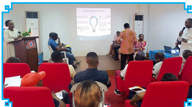
Les échanges interactifs

L e 10 décembre 2025, le CNCC a organisé, au Musée Maritime de Douala, un séminaire sur le thème : « Comprendre et maîtriser les formalités administratives et douanières à l'import pour améliorer la compétitivité des chargeurs ». Cette session visait à renforcer les capacités des opérateurs économiques sur le Bordereau Électronique de Suivi des Cargaisons ( BESC 3.0 ), outil numérique clé dans la traçabilité et le suivi des cargaisons importées.