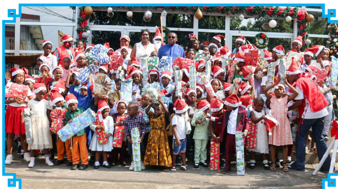
Les heureux bénéficiaires posent avec leurs cadeaux

À l'occasion des fêtes de fin d'année, le Conseil National des Chargeurs du Cameroun (CNCC) a organisé, comme chaque année, son événement phare dédié aux tout-petits : « Noël des enfants au Musée Maritime de Douala ». Du 20 au 24 décembre 2025, plus de trois cents enfants âgés de 3 à 15 ans ont pris part aux activités festives et éducatives organisées dans l'enceinte du musée. Les enfants ont eu l'opportunité de visiter les expositions, de découvrir la célèbre Case des tempêtes, et de plonger dans l'univers maritime à travers des animations interactives.