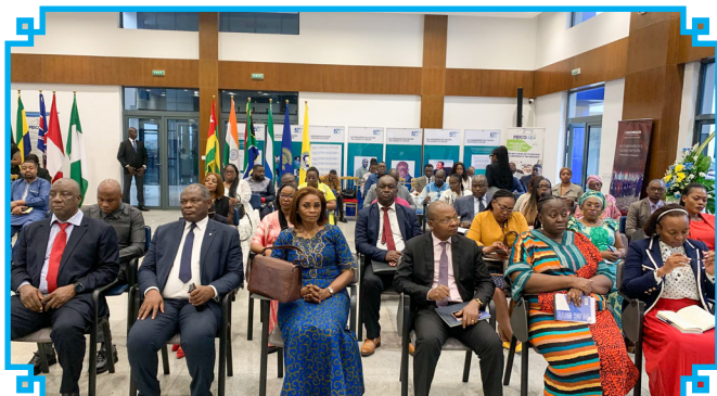
Les participants à la rencontre

Le 04 décembre 2025, le siège du Fonds Spécial d'Équipement et d'Intervention Intercommunale (FEICOM) à Yaoundé a accueilli la rencontre semestrielle des Partenaires Stratégiques du CWEIC Hub Cameroun-Gabon-Togo-Sierra Leone, sous l'égide du Commonwealth Enterprise and Investment Council (CWEIC).