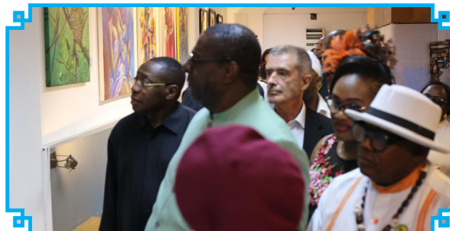
La découverte des œuvres d'art

Des artistes plasticiennes exposent leurs œuvres d'art.