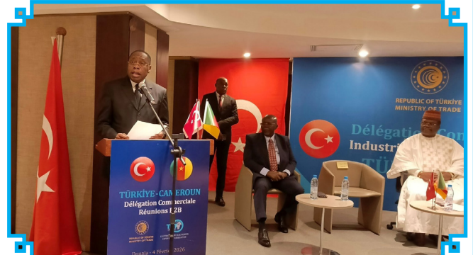
Le mot du Directeur Général du CNCC

Le Directeur Général du CNCC a conduit une délégation aux travaux de la mission économique Turquie-Cameroun.