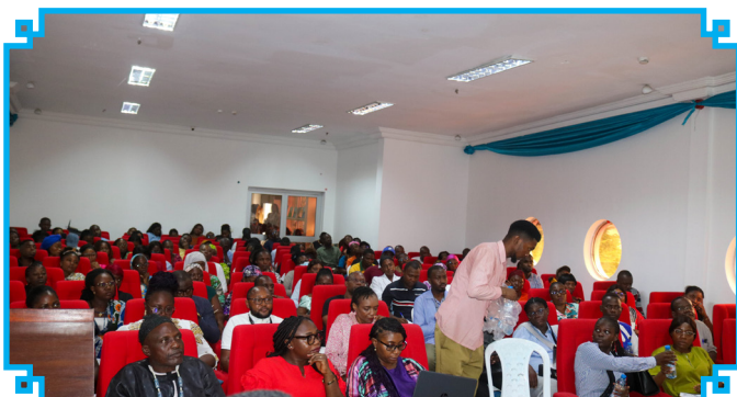
Les participants aux travaux

Les Chargeurs ont participé au séminaire de formation organisé par le CNCC.